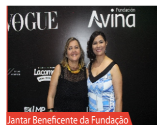
Jantar Beneficente da Fundação Avina e Revista Vogue