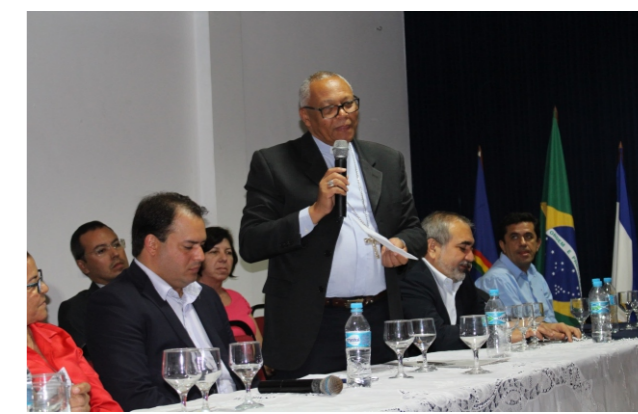
Consórcio Intermunicipal Dom Mariano