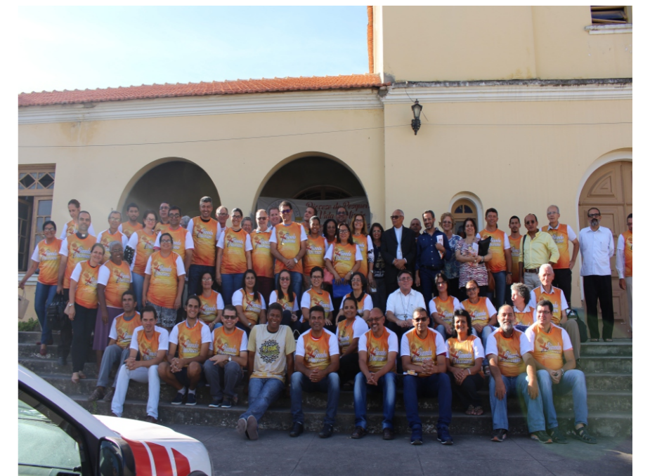
Encerramento da 5ª Sessão do Sínodo Diocesano

Por Fabiana Francelino, Núcleo de Comunicação da Caritas Diocesana de Pesqueira