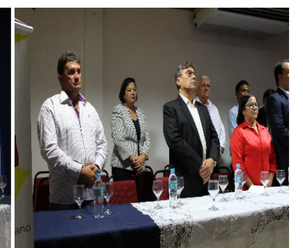
Posse da diretoria do Condomar