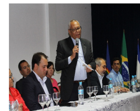
Posse da diretoria do Condomar