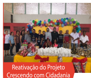
Reativação do Projeto Crescendo com Cidadania