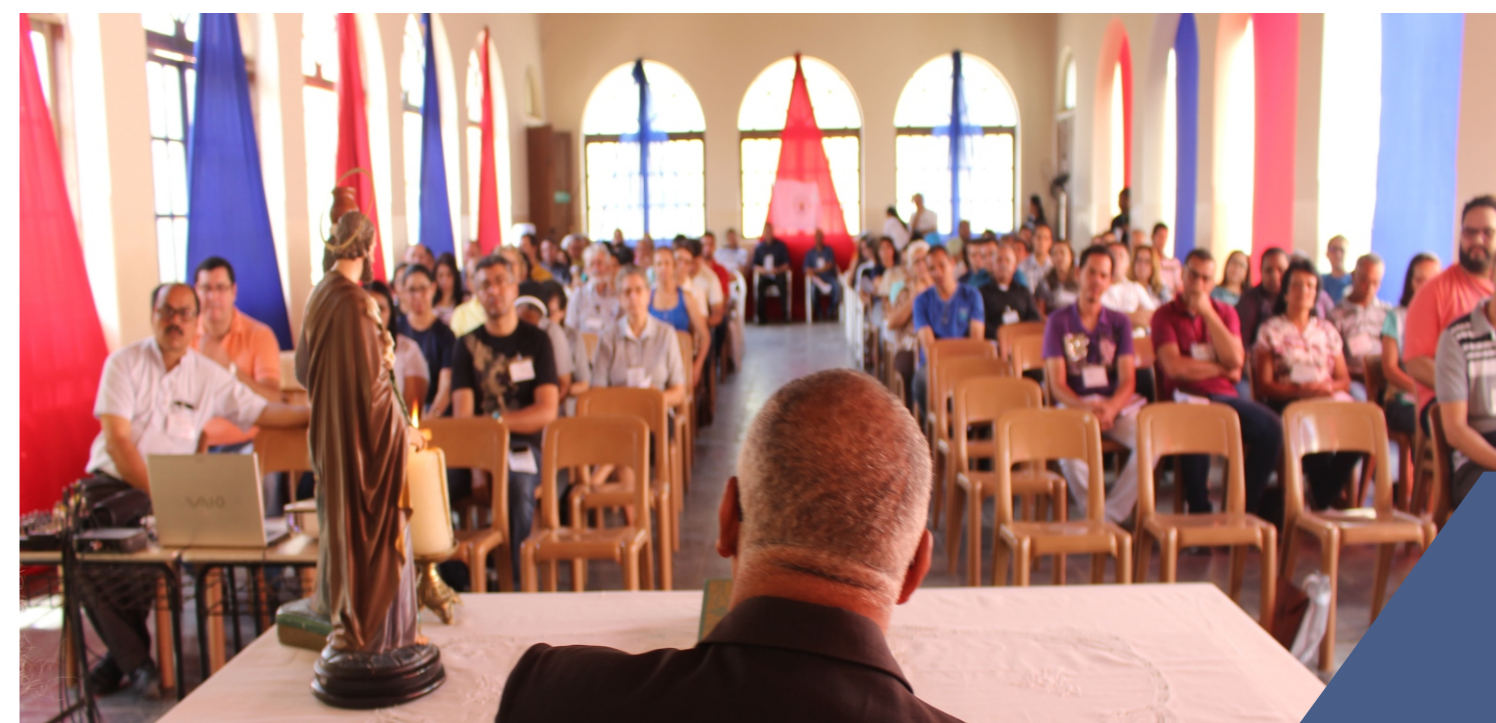
Cáritas Diocesana assessora a 5ª Sessão do Sínodo Diocesano