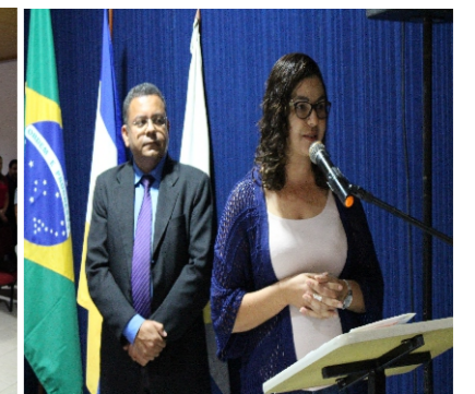
Posse da diretoria do Condomar