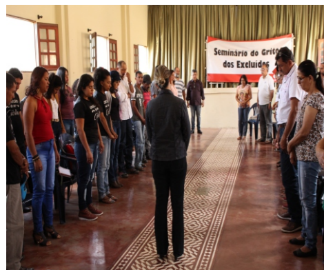
Seminário do Grito dos Excluídos