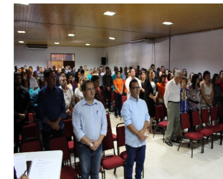
Posse da diretoria do Condomar