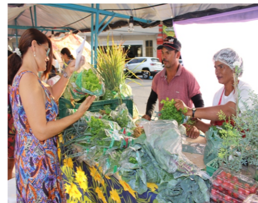
Comercialização da Feira da Agricultura Familiar

Em todas as edições os (as) agricultores (as) sugerem uma programação especial, como: apresentações musicais, desfiles, danças típicas, além da comercialização de uma variedade de alimentos produzidos por eles como verduras, legumes, hortaliças, manteiga de gado, bolos, doces, ovos, galinha de capoeira, derivados de carne e leite, comidas típicas, artesanatos e entre outros.