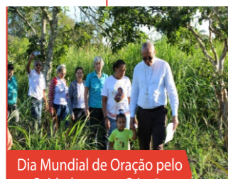
Dia Mundial de Oração pelo Cuidado com a Criação