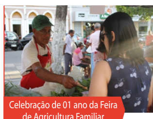
Celebração de 01 ano da Feira de Agricultura Familiar