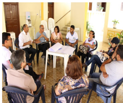
Seminário do Grito dos Excluídos

Ao final do Seminário foi discutida a necessidade de continuidade deste processo, formando assim, uma Rede dentro do território diocesano. Como proposta foi concebida a formação do Fórum Territorial de Incidência Social, que terá representações de cada região pastoral.