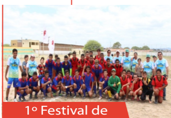
1º Festival de Solidariedade