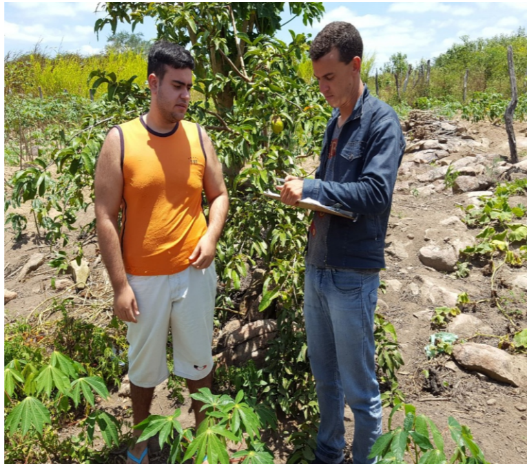
Mobilização das famílias em Tupanatinga

Executado pela Diocese de Pesqueira, através da Caritas Diocesana, a programação de acordo com a liberação dos recursos para o segundo semestre de 2017 foram iniciadas para a construção de 323 cisternas. Distribuídas da seguinte forma entre os municípios: 120 em Tupanatinga, 60 em Pedra e Itaíba para cada cidade, e, 83 em Buíque, o que beneficia diretamente 323 famílias, possibilitando a condição para