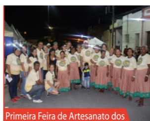
Primeira Feira de Artesanato dos Idosos da Cáritas