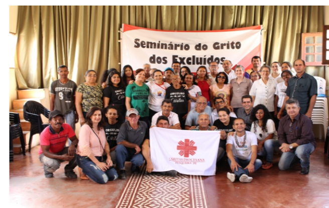
Seminário do Grito dos Excluídos