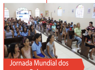
Jornada Mundial dos Pobres