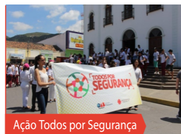
Ação Todos por Segurança