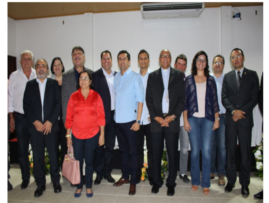
Posse da diretoria do Condomar